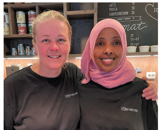
Hjertrom kaffe og te

Vi ønsker dere alle en velsignet julehøytid!