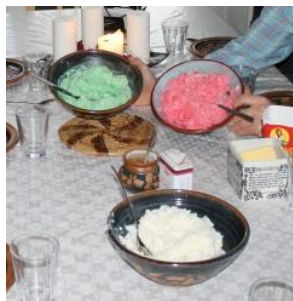
Informasjon til julegrøt

Hva er julegrøt? Vanlig grøt med rød og grønn konditorfarge i 😊. Lurt med litt hvit grøt i reserve for de som bryner litt på nesen 😊.